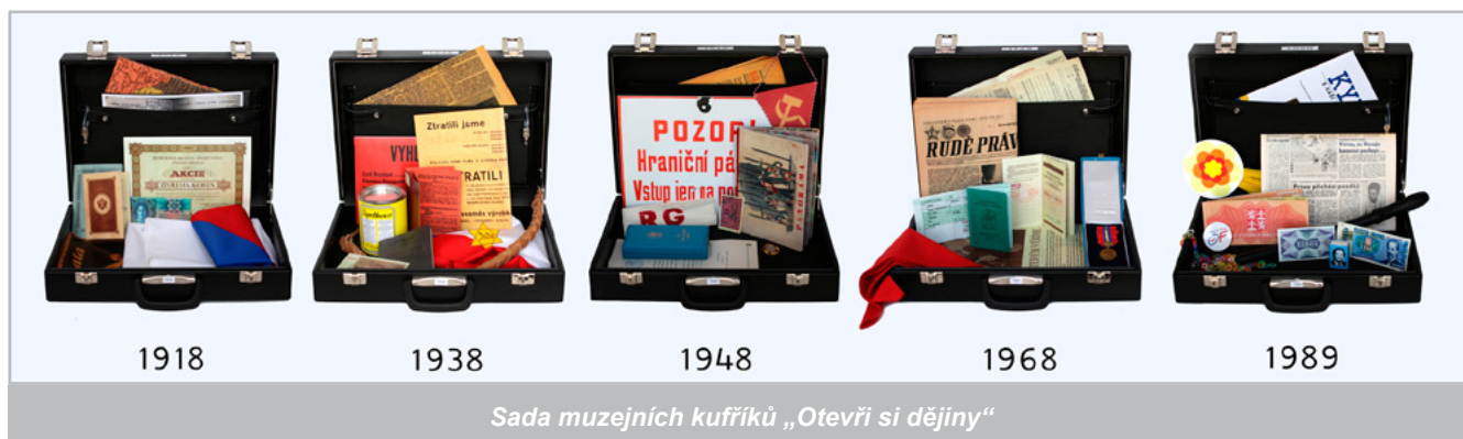
Sada muzejních kuffíků „Otevři si dějiny“

Nejpopulárnějším výstupem projektu je určitě aktivita „Otevři si dějiny“. Jedná se o sadu pěti muzejních kuffíků, z nichž každý se vztahuje k jedné ze zlomových epoch českých a československých dějin 20. století. Každý muzejní kuffík obsahuje 10 typických předmětů pro dané období s popisem a podpůrným metodickým materiálem. Na poli digitálního obsahu by