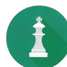
Kluby a volnočasové aktivity