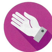
Školní asistent, psycholog, speciální pedagog