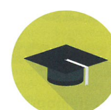
Další vzdělávání pedagogických pracovníků