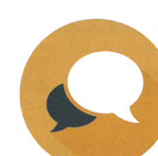
Spolupráce pedagogů, rodičů a školy