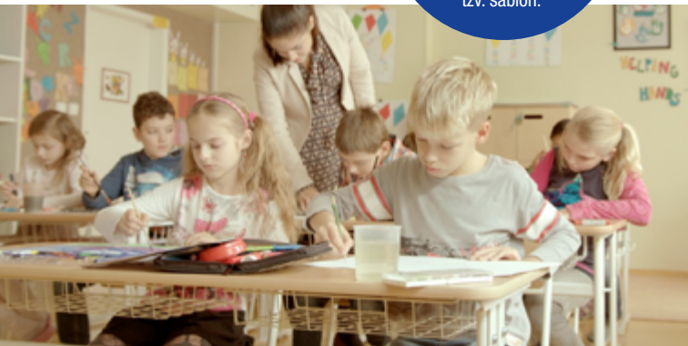
Ukázka televizní kampaně

Pokračovala mediální kampaň OP VVV Pomáháme pomáhat, učit a bádát. Televizní spoty, tematicky zaměřené na konkrétní oblasti podporované z OP VVV, v roce 2017 doplnila také online a tisková část mediální kampaně. OP VVV byl podle průzkumu, který v květnu 2017 provedla Médea Research, nejznámějším operačním programem v celé české populaci.