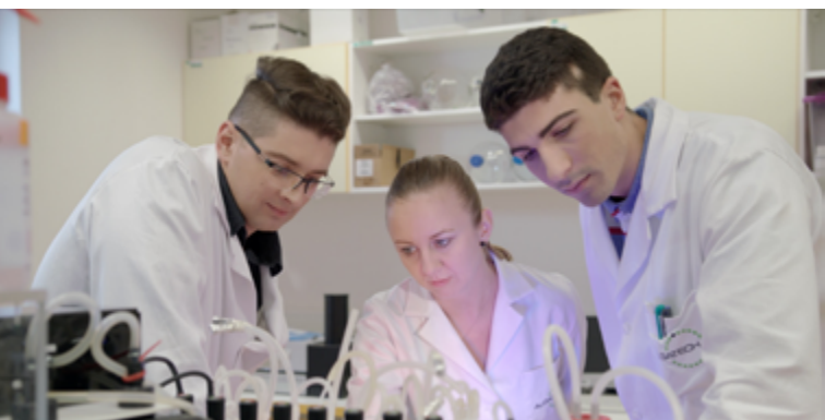
Ukázka televizní kampaně