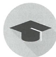
Další vzdělávání pedagogických pracovníků