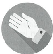
Školní asistent, psycholog, speciální pedagog