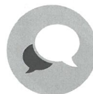
Spolupráce pedagogů, rodičů a školy