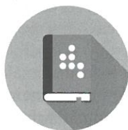
Speciální učebnice a pomůcky