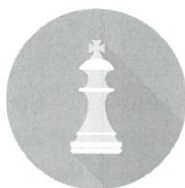
Kluby a volnočasové aktivity