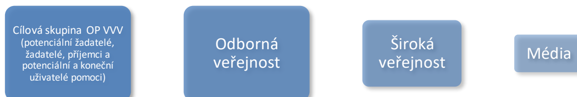
Schéma č. 2.: Cílové skupiny komunikace pro rok 2021, dle míry relevance

RKoP popisuje komunikační aktivity pro 4 základní cílové skupiny komunikace: 2 cílovou skupinu OP VVV, odbornou veřejnost, širokou veřejnost a média, které jsou dále definovány ve specifických podskupinách dle prioritních os OP VVV. Následující schéma znázorňuje cílové skupiny komunikace pro rok 2021.