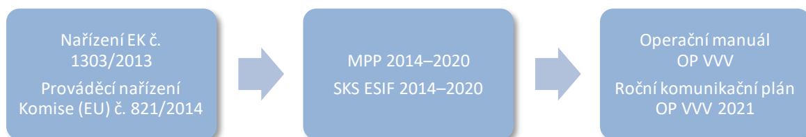
Schéma č. 1: Provázanost metodických dokumentů pro oblast publicity fondů EU

RkoP v detailnější míře definuje hlavní cíle informování a publicity OP VVV, komunikační témata a nástroje zvolené pro splnění nastavených cílů a indikátorů s rozlišením pro jednotlivé cílové skupiny. Dokument obsahuje rovněž konkrétní informace o plánovaných informačních a komunikačních aktivitách, o vykazování plnění indikátorů v roce 2021, o indikativních finančních nákladech a předpokládaných termínech realizace v měsíčním členění. Následující schéma ukazuje provázanost metodických dokumentů pro oblast publicity fondů Evropské unie (dále jen „EU“).