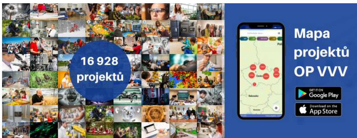
V mobilní aplikaci Mapa projektů OP VVV bylo k 31. 12. 2020 zpřístupněno téměř 17 tisíc projektů.

ŘO v návaznosti na zkušenosti s realizací OP VVV intenzivně připravoval intervence pro budoucí programové období 2021–2027. V říjnu 2020 proběhlo online formou již třetí jednání Přípravného výboru Operačního programu Jan Amos Komenský (dále jen OP JAK), na kterém byl představen indikativní plán intervencí OP JAK. Na webových stránkách MŠMT byl též zveřejněn první návrh Programového dokumentu OP JAK https://opvvv.msmt.cz/aktualita/ .