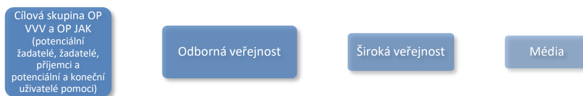
Schéma č. 2.: Cílové skupiny komunikace pro rok 2022, dle míry relevance

RKoP popisuje komunikační aktivity pro 4 základní cílové skupiny komunikace: 2 cílovou skupinu OP VVV a OP JAK, odbornou veřejnost, širokou veřejnost a média, které jsou dále definovány ve specifických podskupinách dle prioritních os OP VVV. Následující schéma znázorňuje cílové skupiny komunikace pro rok 2022.