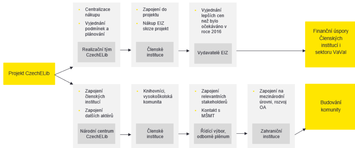
Schéma 1 Neočekávané výsledky projektu

Vysvětlení nezamýšlených dopadů je podloženo tvrzeními z řízených rozhovorů. Co se týče finančních úspor , tak se jedná o efekt projektu, který nebyl na počátku slíben, ale který členské instituce hodnotí jako jeden z hlavních přínosů. Jak uvedli dotázaní respondenti, finanční přínos nebyl viditelný pouze pro členské instituce, ale také pro celý sektor VaVal. Díky projektu došlo k zefektivnění pořizování EIZ jednotlivými institucemi a k lepšímu zhodnocení reálných nákladů. Realizačnímu týmu CzechELib se podařilo vyjednání lepších cenových nabídek, než bylo plánováno před začátkem projektu. Vzhledem k zapojení členských institucí došlo k centralizaci nákupu EIZ a ke snížení nákladů na EIZ poskytovaných jednotlivými institucemi.